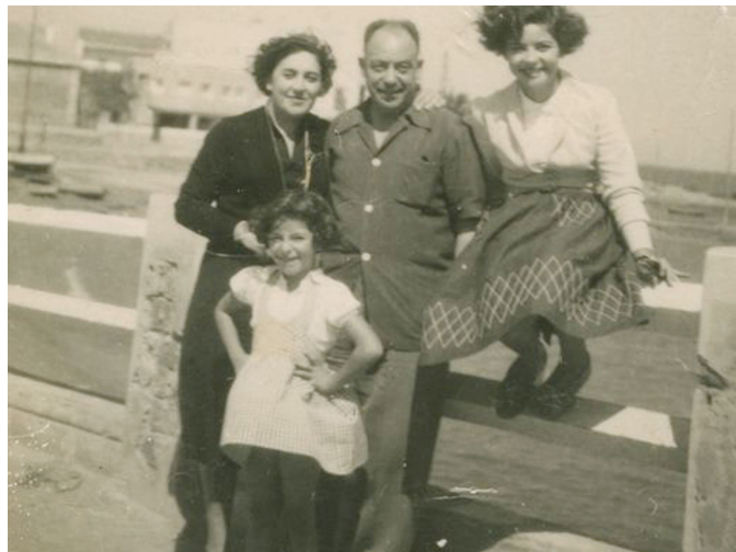
Algérie 1962, l'été où ta famille a disparu...