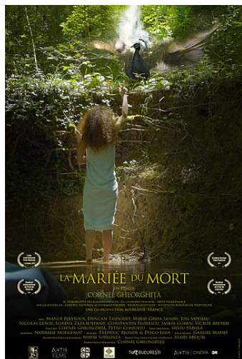
Affiche du film - La Mariée du Mort de Cornel Gheorghita