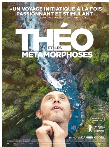
Affiche du film - Théo et les métamorphoses