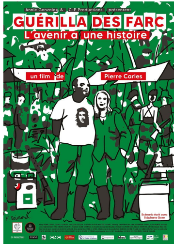
Affiche du film - Guerrilla des Farc de Pierre Carles © 2024 CP Productions