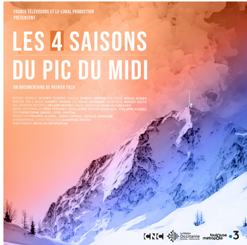
Les Quatre Saisons du pic du Midi, un film de Patrick Foch