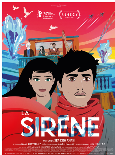
Affiche - La Sirène de Sepideh Farsi © Les Films d'ici - Bac Films

2021 / 1 H 40 / ALLEMAGNE, BELGIQUE, FRANCE, LUXEMBOURG