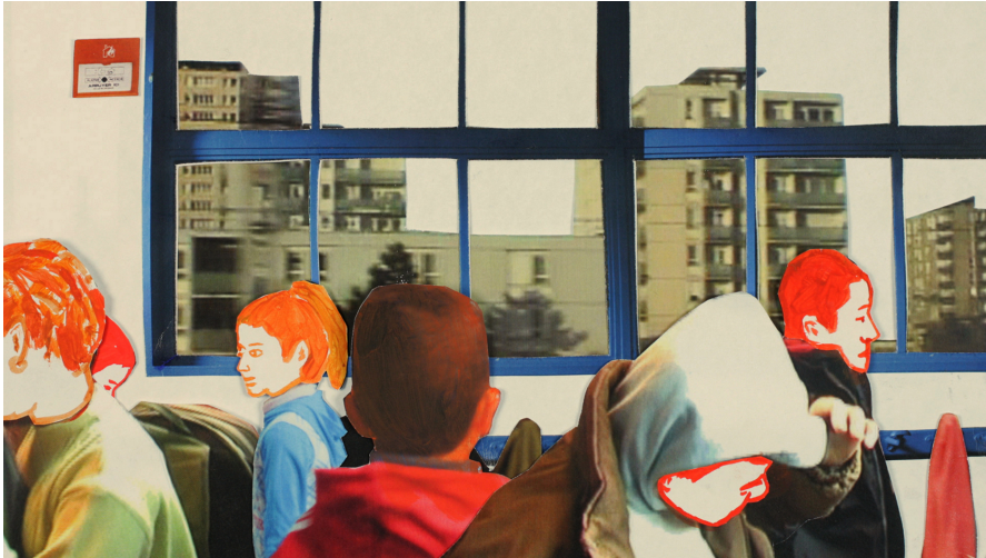
Le COD et le coquelicot - Photo du film