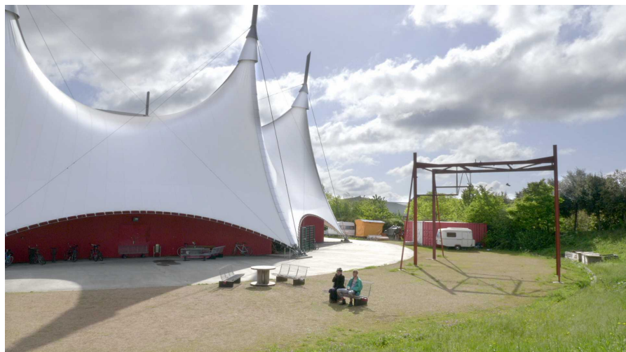
French Circus - Photo du film