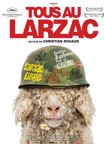
Affiche du film Tous au Larzac