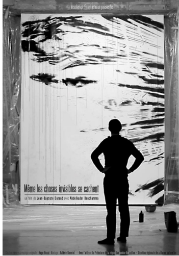
Même les choses invisibles se cachent, un film de J.-B. Durand