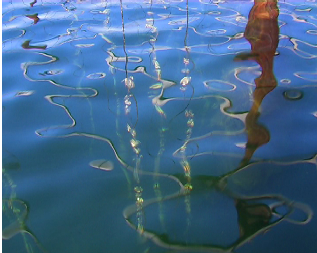
Les Hommes et l'étang « et si le printemps ne revenait pas ? »