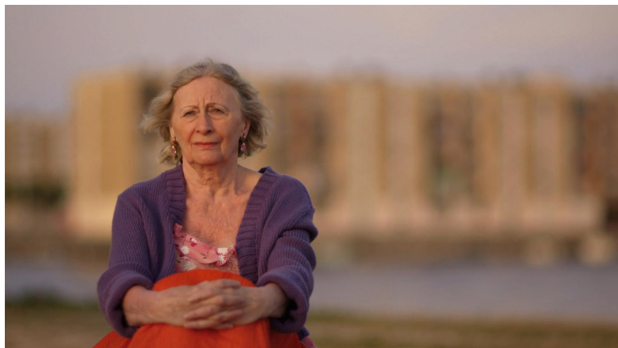
Chaque jour est une petite vie, un film de Albane Fioretti et Lou-Brice Léonard