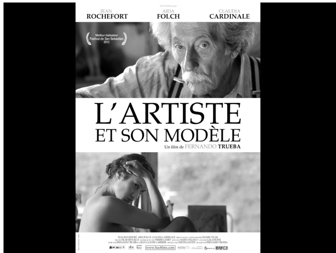
L'Artiste et son modèle