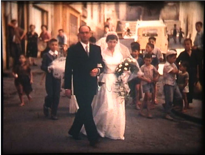
Mère méditerranéenne - © Jean-Luc Saumade