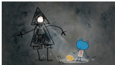
Un dessin préparatoire représentant la figure du danger pour Zotil.

Initialement intitulé Le Nouveau , le scénario d'Éric Montchaud coécrit par Cécile Polard attire l'attention du producteur Luc Camilli de la société Xbo Films avec qui le réalisateur a déjà collaboré pour la série animée Kiwi . En 2016, le projet remporte le Prix Folimage au Marché international du film d'animation d'Anney (MIFA). Le tournage est ensuite lancé au studio de La Ménagerie, près de Toulouse, mêlant à la fois du dessin et de l'animation en volume aussi appelée stop motion. Pour la musique, Éric Montchaud fait appel à Pierre Bastien, signant ainsi sa troisième collaboration avec ce compositeur expérimental. Distribué par Gebeka Films, Un caillou dans la chaussure est présenté au Festival de Clermont-Ferrand et obtient le prix du jury junior au Festival d'Anney en 2021.