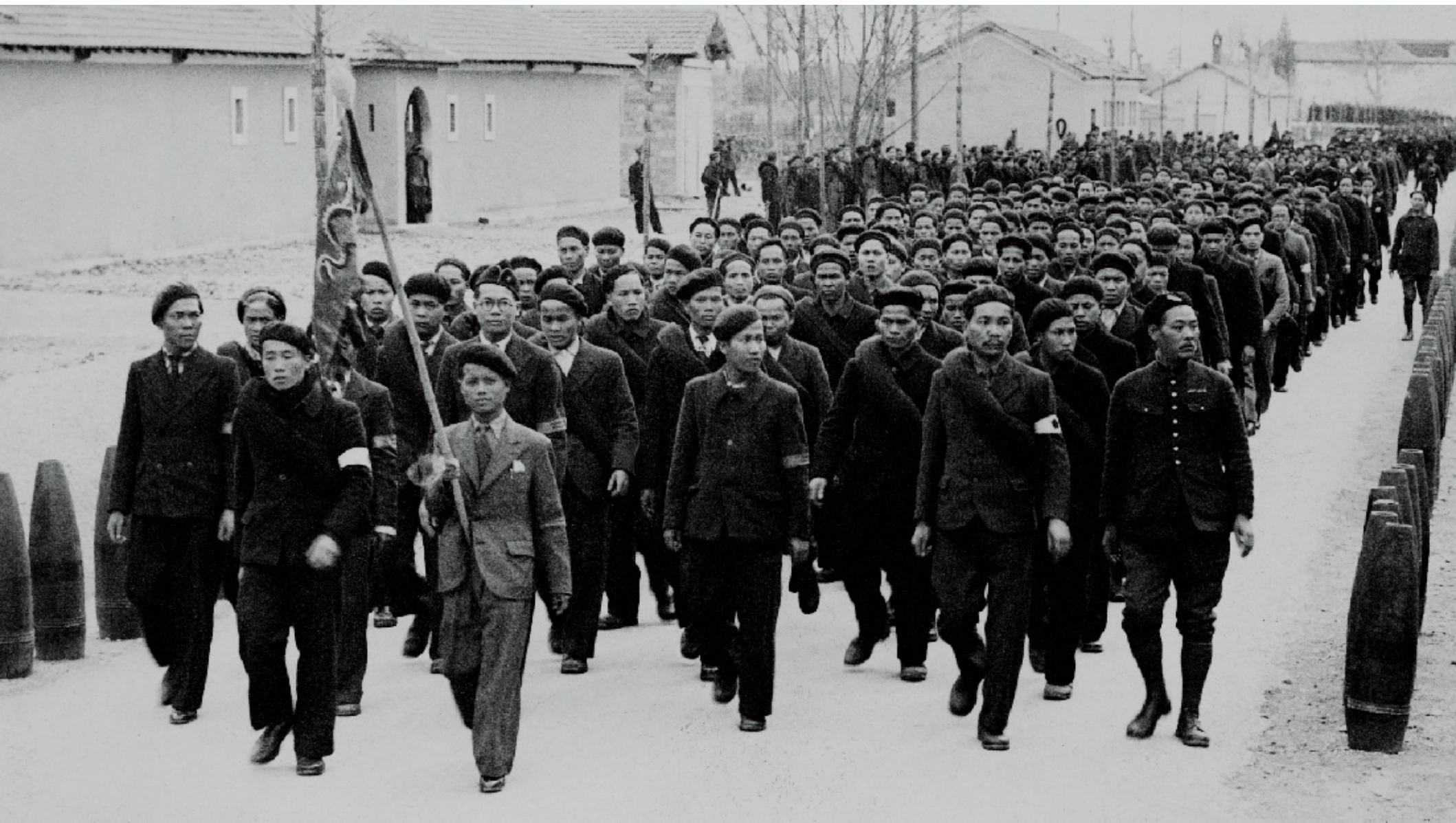
la 2ème légion de Cong Binh camp de Bergerac