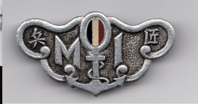
ECUSSON DE LA M.O.I Main d'Oeuvre Indigène