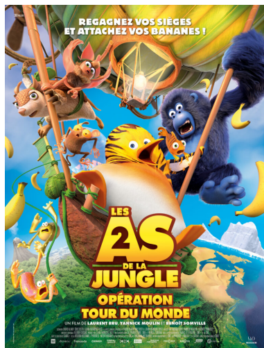
Affiche - Les As de la Jungle 2 Objectif tour du monde © TAT productions | SND | France 3 Cinéma | 2023