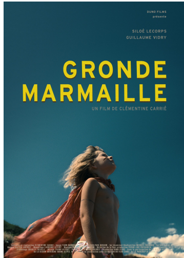
Gronde Marmaille - Affiche du film