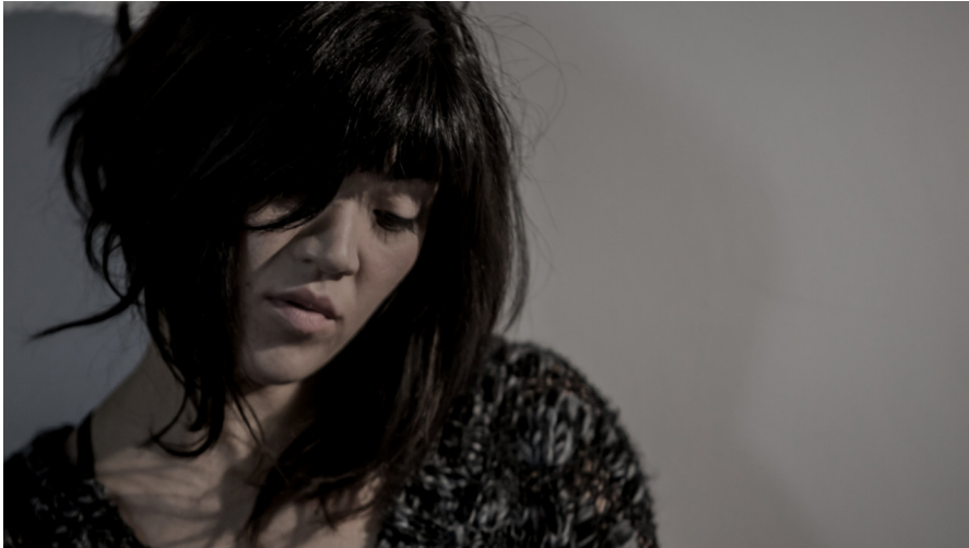
Séisme - Photo du film