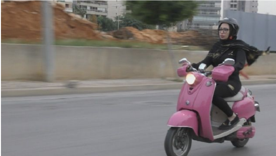
La Fille au scooter