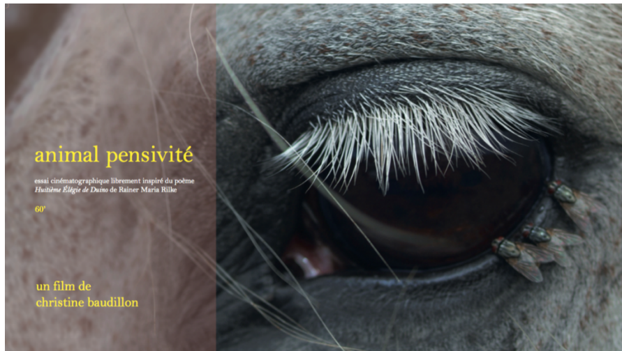
Animal pensivité. Affiche du film de Christine Baudillon