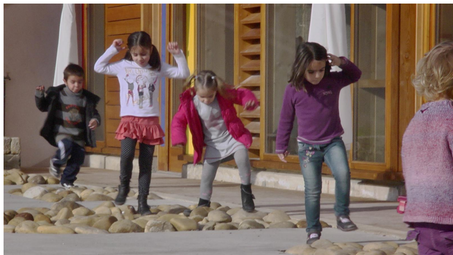
Photo du film La Davalade, une école pour demain