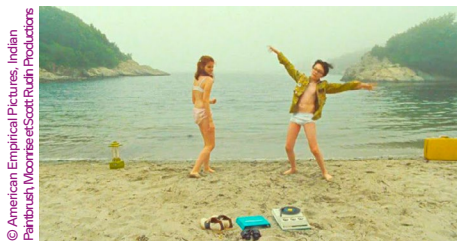
Seuls en pleine nature, Sam et Suzy se déhanchent frénétiquement sur Le Temps de l'amour de Françoise Hardy.

Sam et Suzy fuguent pour vivre leur amour en totale liberté, loin de l'irresponsabilité de leurs parents respectifs : Moonrise Kingdom de Wes Anderson (2008).